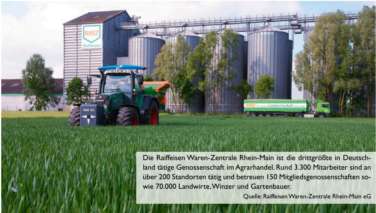
Die Raiffeisen Waren-Zentrale Rhein-Main ist die drittgrößte in Deutschland tätige Genossenschaft im Agrarhandel. Rund 3.300 Mitarbeiter sind an über 200 Standorten tätig und betreuen 150 Mitgliedsgenossenschaften sowie 70.000 Landwirte, Winzer und Gartenbauer.